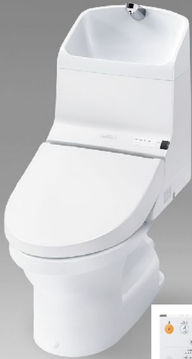
ウォシュレット用リモコン