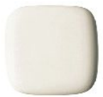
#SC1 パステルアイボリー