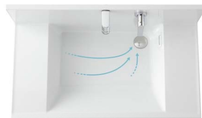
ボウル一体カウンター(実容量17L)