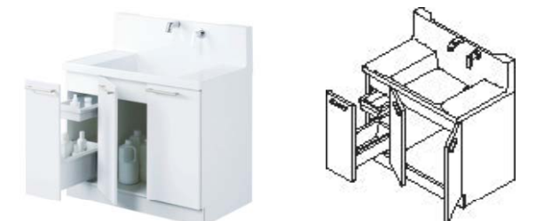
片引き出しタイプ(間口900mm)