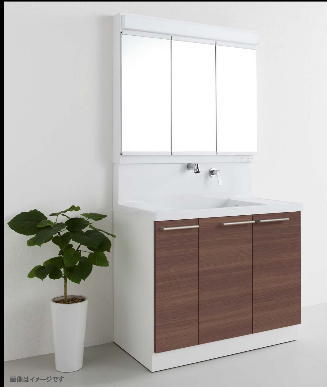
画像はイメージです