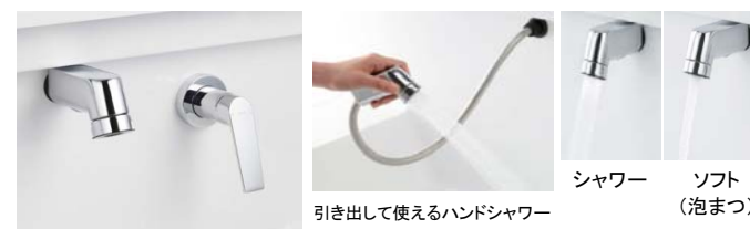
エアインシャワー水栓